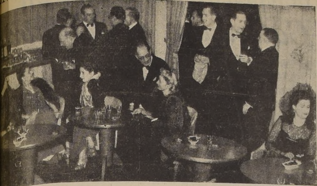
Baby Bar del Roof Garden, durante un cocktail antes de los dinner-danzants.