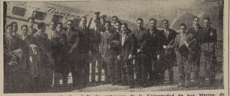
Miembros de la delegación de estudiantes peruanos de la Universidad de San Marcos, de Lima, que ayer arribaron a Santiago, en un avión especial de la Línea Aérea Nacional, procedentes de Arica.

CONTINUAN LLEGANDO DELEGACIONES DE DISTINTOS PAISES DEL CONTINENTE