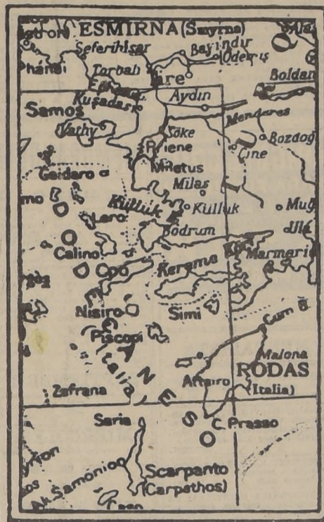
El archipiélago del Dodecaneso, ganado por Italia a raíz de la guerra italo-turca, tiene gran valor estratégico por dominar la entrada oriental del Mar Egeo...