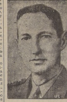
General MARK CLARK