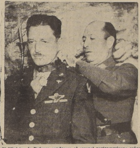
El Ministro de Defensa condecora al coronel norteamericano señor Niegarth.

LA INSIGNIA CORRESPONDIENTE LE FUE ENTREGADA POR EL MINISTRO DE DEFENSA NACIONAL