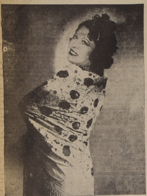
Mezzo soprano Conchita Velázquez, que ha cantado "Carmen", de Bizet, doscientas ochenta y seis veces, y cuya interpretación personalísima le ha valido clamorosos éxitos en los principales escenarios líricos del mundo.