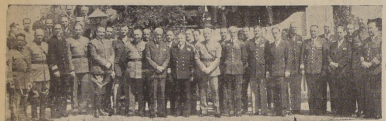
Parte de los asistentes a la manifestación ofrecida al Comodoro del Aire, don Manuel Tovarias.

CON UN ALMUERZO EN EL CASINO DE LA ESCUELA DE AVIACION DE "EL BOSQUE"—ASISTIERON EL MINISTRO DE DEFENSA NACIONAL Y DESTACADAS PERSONALIDADES.—OBSEQUIO AL CORONEL NIEGARTH