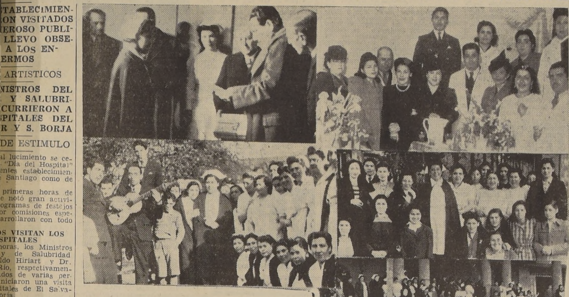
Arriba, a la izquierda, el Ministro de Salubridad en el Hospital de El Salvador. — Otros aspectos de la celebración del Día del Hospital