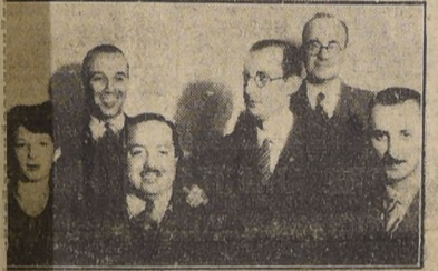
Delegación universitaria argentina, que visitó ayer LA NACION

SE REALIZO AYER.— LA DELEGACION TRASEGUE PARTICIPIO EN EL RECIENTE CONFERENCIO ESTUDIANTES VISITO "LA NACION"