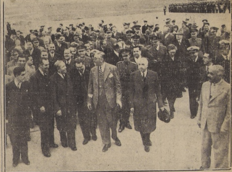
S. E. acompañado del Ministro del Interior, otros Secretarios de Estado, jefes superiores de las Fuerzas Armadas y altos funcionarios públicos, momentos después de su arribo al Puerto Aéreo de Los Cerrillos, en la tarde de ayer