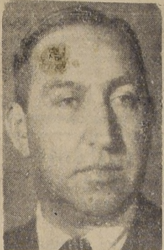
Ministro de Vías y Obras, don Abraham Alcaino