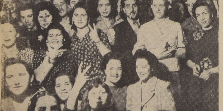
Grupo de asistentes a la fiesta de ayer en el Centro Republicano Español.

RECEPCION EN LA EMBAJADA DE ESPAÑA Brillantes caracteres alcanzó la recepción oficial ofrecida ayer por el Embajador de España, Excmo. Sr. Luis Martínez de Irujo, Marqués de los Arcos, con asistencia de S. E. el Presidente de la República don Juan Antonio Ríos y esposa, señora Marta Ido de Ríos, ministros de Estado, miembros del Cuerpo Diplomático, del Arzobispo de Santiago, Monseñor José María Caro, parlamentarios, altos jefes de las Fuerzas Armadas, y representantes personalidades de nuestro mundo social y administrativo.