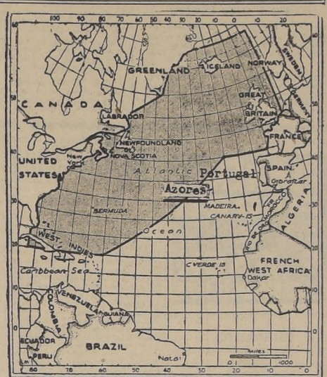
Las Azores se hallan situadas a mil millas de la costa portuguesa...