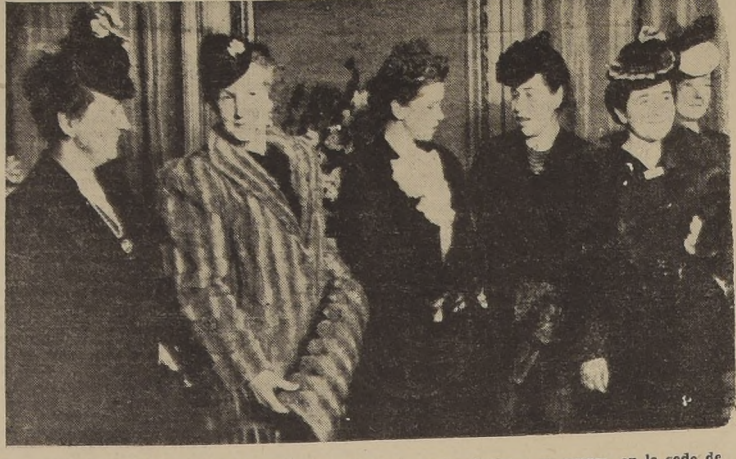
Impresiones tomadas por nuestros fotógrafos en la brillante recepción ofrecida en la tarde de ayer por el Embajador de España Excmo. señor Marqués de los Arcos y su esposa, en la sede de la Embajada, con motivo del Día de la Raza. Esta fiesta, a la cual concurren S. E. el Presidente de la República y Ministros de Estado, miembros del Cuerpo Diplomático, representantes de las Fuerzas Armadas, y otras destacadas personalidades, alcanzó los relieves de un verdadero acontecimiento social.