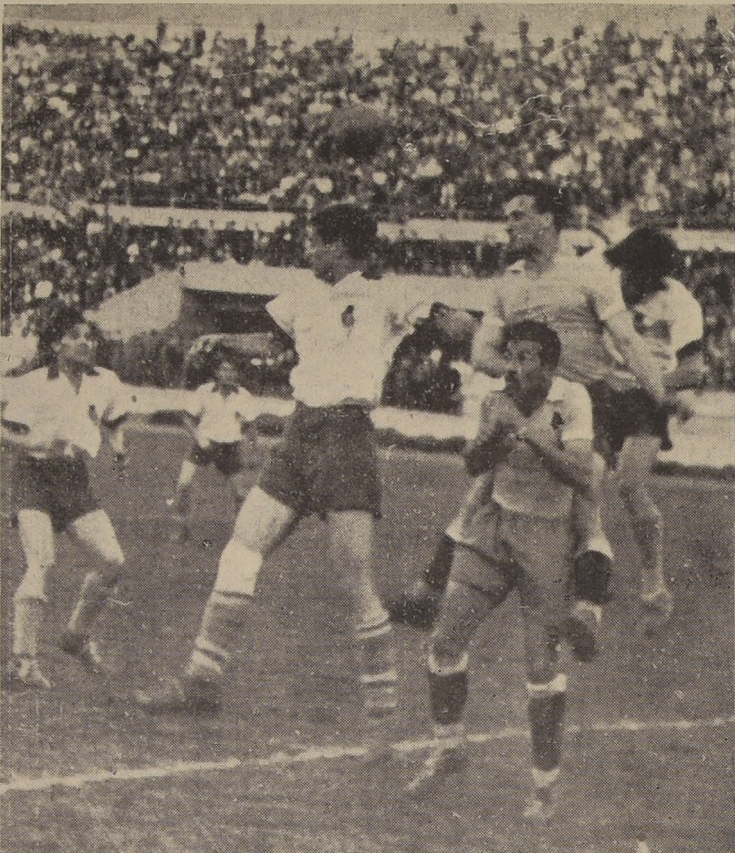
EN EL CAMPO URUGUAYO.— La defensa de los orientales se defiende con mucha dificultad ante un ataque de los universitarios chilenos