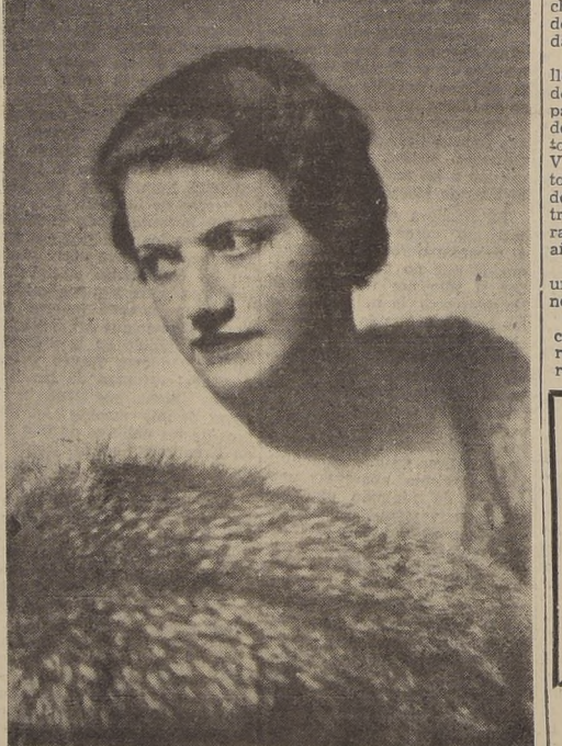
ROSE PAULYS la gran soprano, trinfadora en los escenarios de Alemania, Austria, Italia y América, que tendrá a su cargo el papel de "Brunilda" en la representación de "WAL KIRIA" que subirá a escena en el Teatro Municipal el viernes 15, en la penúltima función de abono. Rose Paulys obtuvo un éxito clamoroso en el Colón de Buenos Aires interpretando "Electra" de Strauss, bajo la dirección del maestro Kleiber.