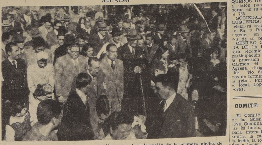
Parte de la numerosa concurrencia que asistió ayer a la colocación de la primera piedra de la Cooperativa de Huertos Obreros "José Maza"