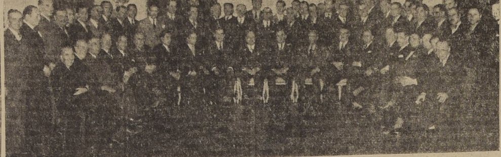
Una parte de los asistentes a la manifestación ofrecida al Presidente de la Cámara de Diputados

FUE FESTEJADO EN EL HOTEL CARRERA POR DIPUTADOS DE TODOS LOS PARTIDOS, FUNCIONARIOS DE LA CAMARA Y PERIODISTAS, CON MOTIVO DE SU PROXIMO VIAJE AL EXTERIOR