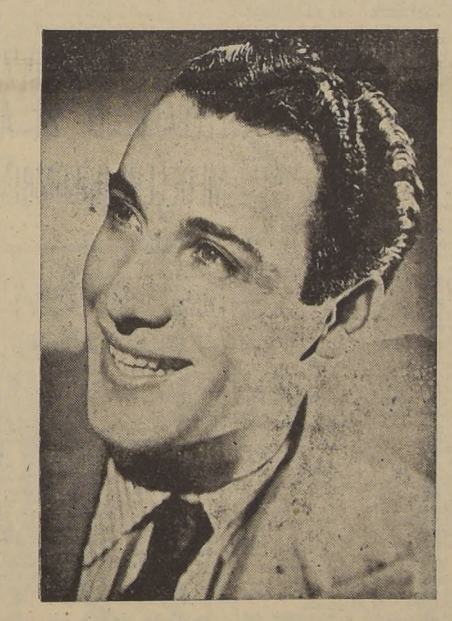
Agustín Irusta ha trabajado en seis de las mejores películas argentinas, como también en la película "UNA MUJER DE ATENAS" y "PUERTA CERRADA" junto con LIBERTAD LAMARQUE

LUCERNA, cumpliendo la promesa de ofrecer a sus distinguidos habitués lo mejor de lo mejor ha contratado al cantante, astro del cine argentino AGUSTIN IRUSTA