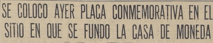
Tres aspectos de la ceremonia de ayer

Saludos Oficiales. Momentos después, el almirante Spears se dirigió a su alojamiento en el Hotel Carrera, donde permaneció algunos minutos, dirigiéndose en seguida al Ministerio de Relaciones Exteriores, con el objeto de presentar sus saludos al Canciller suriente, señor Moller. El representante de Estados Unidos, departir durante varios instantes con el señor Moller. Después el almirante Spears visitó al Ministro de Defensa Nacional, general señor Oscar Escudero y a los comandantes en jefe de las tres ramas de la Defensa. Durante estas visitas fué acompañado por el Adicto Naval de Estados Unidos, capitán de fragata, señor Joseph P. Rockwell, y por sus ayudantes chilenos: teniente coronel, señor Manuel Delano; capitán de fragata, don Gerardo Tridgett y comandante de grupo, don Ismael Sarata.