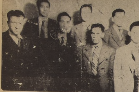
El fuerte equipo de Sewell que dirige el ex campeón de Chile, Manuel Artico