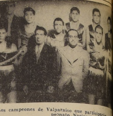
Los campeones de Valparaíso que participarán en el campeonato Nacional

Presenta hoy. A las 20.30 horas. ESCENAS DE ALEMANIA DEL NUEVO ORDEN. RADIO LA AMERICANA CB 130 y CE 960. RADIO PRAT CB. 97. A LAS 1.15 HORAS "EL HUESPED" (4.º episodio) RADIO SOCIEDAD NACIONAL DE MINERIA CB 126.