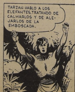
TARZAN HABLO A LOS ELEFANTES, TRATANDO DE CALMARLOS Y DE ALERTARLOS DE LA EMBOSCADA.