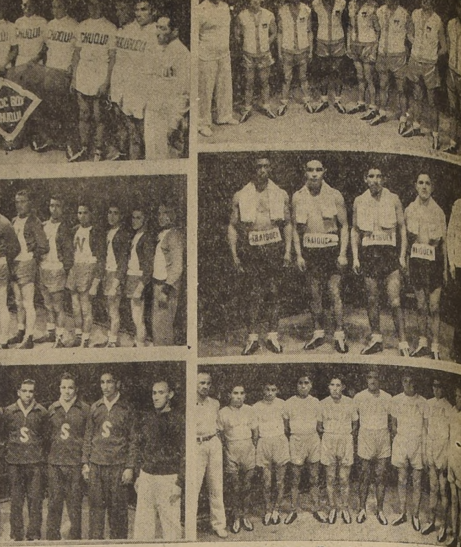
Parte de las brillantes delegaciones de provincias al campeonato Nacional de Box Amateurs...