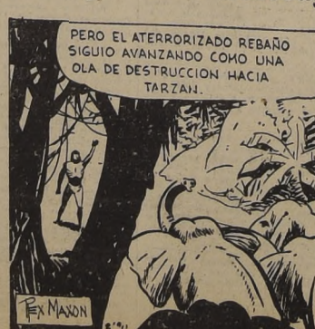
PERO EL ATERRORIZADO REBAÑO SIGUIÓ AVANZANDO COMO UNA OLA DE DESTRUCCION HACIA TARZAN.