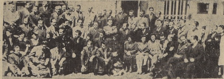
Asistentes al 42.º aniversario de la "Unión de Peluqueros"

EL PROGRAMA DESARROLLADO EN AMBAS INSTITUCIONES - MANIFESTACIONES DE CAMARADERIA