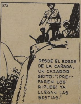
DESDE EL BORDE DE LA CAÑADA, UN CAZADOR GRITO: "¡PREPAREN LOS RIFLES! YA LLEGAN LAS BESTIAS."