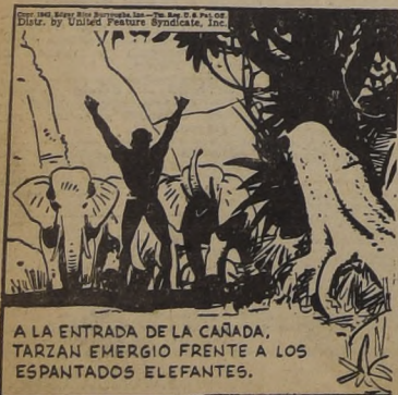
A LA ENTRADA DE LA CAÑADA, TARZAN EMERGIÓ FRENTE A LOS ESPANTADOS ELEFANTES.