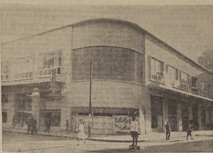
La nueva construcción levantada en calle Estado esquina de Moneda.

locales comerciales independientes con primer piso, altílo, segundo piso y tres toilettes cada uno, distribuidos en la siguiente forma: 5 locales a calle Estado, 5 locales a calle Moneda, un local esquina y 8 locales interiores.