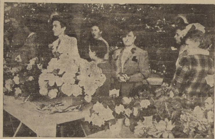
Algunos asistentes al Concurso Floral que se realiza en los Jardines del Stade Français y que ha llamado justamente la atención del público por la belleza y frescura de las flores que allí se exhiben. La exposición estará abierta durante el día de hoy de 10 a 19 horas y también se servirá té y refrescos.