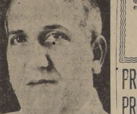
Excmo. señor Ricardo Adolfo de la Guardia, Presidente de Chile

En homenaje al aniversario patrio de Panamá, el Instituto Chileno Panameño de Cultura ha preparado para esta tarde, a las 19:30 horas en el Salón de Honor de la Universidad de Chile,