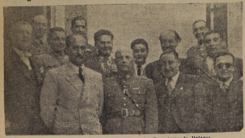
Asistentes al almuerzo de ayer en honor de los Reporteros de Defensa.