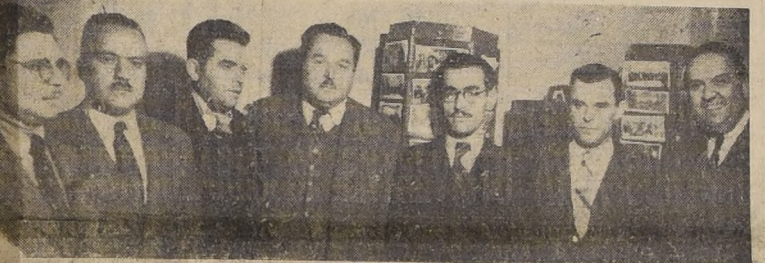
DIRIGENTES DE LA CONFEDERACION DE EMPLEADOS PARTICULARES QUE FUERON RECIBIDOS AYER POR S. E.

EXPUSO AL PRIMER MANDATARIO LOS ANTECEDENTES RELACIONADOS CON EL CONFLICTO DE LA OFICINA MAPOCHO.— EL EXCMO. SR. RIOS PRO METIO SOLUCIONARLO