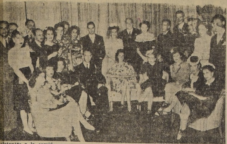
Asistentes a la comida que se efectuó en el Roof-Garden del Hotel, en honor del teniente Edward Dougherty, Agregado Naval a la Embajada de Estados Unidos, con motivo del regreso a su patria.