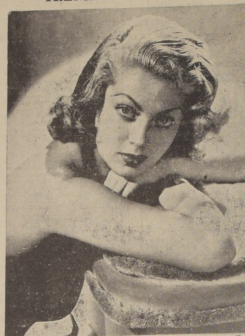
Elegantemente ataviada por Irene, la famosa modista de Hollywood, la hermosa Lana Turner, junto a Robert Young, protagonista de la deliciosa comedia "La Fingida Cenicienta", que estrenará el próximo viernes el Teatro Metro

Una Cenicienta de los tiempos actuales, una encantadora muchacha que, de la noche a la mañana, se ve transportada de la pobreza a la más alta opulencia. El viejo, pero encantador cuento aplicado a una adorable ventajosa de una tienda. Tal es, en esencia, el argumento de "La Fingida Cenicienta", la deliciosa y graciosa película que estrenará el Teatro Metro el próximo viernes. Lana Turner, hermosa y seductora, lleva el papel de la pobre muchacha que se transforma en la dama más cotizada de la más alta sociedad. Vestida por Irene, la modista más famosa de los Estudios de la Metro-Goldwyn-Mayer, presenta una sobria e impactante de mujer elegante que encantará a nuestras damas y seducirá a los hombres. Robert Young, el grande y joven actor, es el héroe de esta graciosa y encantadora comedia que viene, en los tiempos de hoy, a proporcionar una lección de saludable optimismo, muy necesaria en la actualidad.