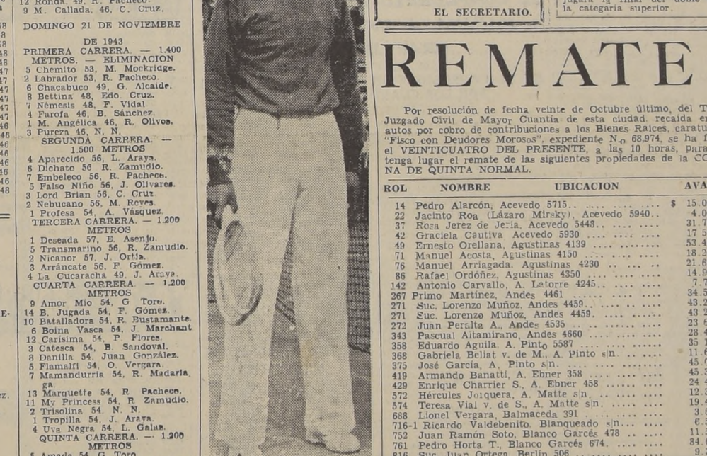
SEGURA CANO.—El popular campeón ecuatoriano de tenis, que en el torneo que se está desarrollando en Buenos Aires se ha constituido en la figura de mayor atracción.