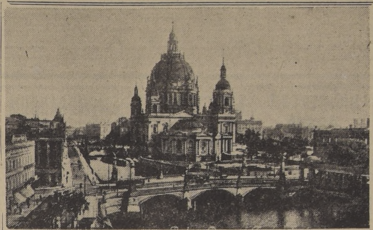
Berlin a orillas del Spree

LONDRES, 19 (UP).—La agencia oficial alemana DNB anunció que fuerzas navales nazis ocuparon la isla de Mikaria, en un amplio frente. Los rusos ocupan ahora dos muy importantes empalmes: este y Korosten, y se espera que pronto vuelvan a estar en Zhitomir para controlar más de 150 kilómetros de ferrocarril. Ovruch está sobre la vía de Korosten a Vlebsk y su captura, consolida la posición de los ejércitos rusos sobre tan vital ferrocarril.