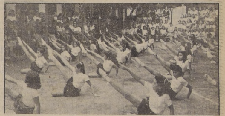
Arriba: el Embajador de Paraguay, autoridades educacionales y otros invitados, presenciando la revista. — Abajo: un aspecto de la presentación que hicieron las alumnas

En la tarde de ayer se efectuó la presentación de educación física y musical de fines de año de las alumnas de la Escuela Republicana de Paraguay, anexa a la Escuela Normal N.º 2. A este acto, concurrieron el Embajador de Paraguay, Excmo. señor José Dahlquist y personal de la Embajada, autoridades educacionales, personalidades padres y apoderados de las alumnas de dicho establecimiento. En esta oportunidad se desarrolló un interesante programa cuyos diversos segmentos demostraron el grado de progreso alcanzado por las alumnas durante el año escolar.