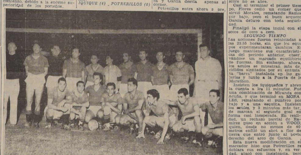
GANO IQUIQUE.—El seleccionado de Iquique, que anoche se impuso en forma concluyente sobre Potrerillos. Pasado mañana le corresponderá enfrentarse a Ovalle en el Estadio Nacional.