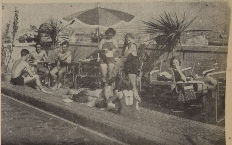
Un aspecto de la hermosa Piscina situada en el 17.º piso del Hotel, donde diariamente se reúne un numeroso y distinguido público, entusiasta de la natación y que se deleita tomando sol y admirando el panorama de nuestra capital.