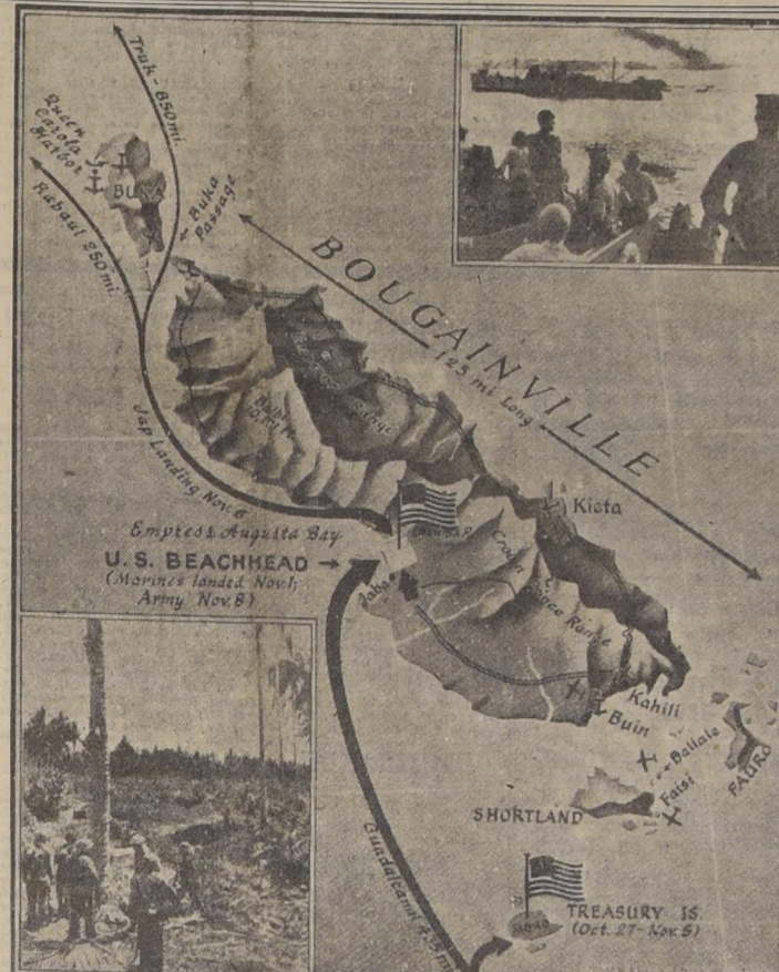
Bougainville es la mayor de las islas que componen el archipiélago Salomón. Esta separada por el Estrecho del mismo nombre de la isla de Choiseul y por el Estrecho del Rey Alberto de la isla de Buka. Tiene junto con la última 10.000 kilómetros cuadrados de extensión y está cubierta de bosques. Sus cumbres más elevadas son el Monte Belbi (3.100 metros) situado en el centro y el Monte Kronprinz (2.265) en el Sur. Pertenció a Alemania desde 1882 hasta la primera guerra europea. Durante la cual fue ocupada por fuerza anglo-australiana. Finalmente, fue dada en mandato a la Confederación Australiana, después de la confagración. En el curso de la presente guerra, fue ocupada por fuerzas de invasión japonesas. Su importancia estratégica estriba en su numerosos aeropuertos y en su cercanía a la base de Rabaul, situada en la isla de Nueva Bretaña.

NUEVA YORK, 13.—(U.P.)— Según los despachos recibidos en los últimos 24 horas, la situación en los diversos frentes de guerra era la siguiente: RUSIA.— El Ejército Rojo volvió a tomar la iniciativa después de tener la contraofensiva nazi en la saliente de Kiev. GUERRA AEREA.— Bombardeos pesados norteamericanos atacaron el aeródromo de Almadén en el día después que aviones "Mosquito" de la R. A. bombardearon sus objetivos en la tarde del domingo. ITALIA.— El Octavo Ejército para tomar las alturas frente a Ortona. El mal tiempo impidió las operaciones en el sector del Quinto Ejército después que la artillería desbarató los preparativos alemanes. Se ha informado que se detuvo el comienzo de la invasión a Italia, han sido capturados 6.000 soldados alemanes. LOS BALCANES.— Se informa que los alemanes están empleando 200 tanques contra los partisans yugoslavos en fuertes ataques continuos. LEJANO ORIENTE.— Los chinos repusieron a los japoneses y reconquistaron varias aldeas al Norte de Chang-Teh, en furiosa lucha. Bombardeos norteamericanos atacaron las bases estratégicas. PACIFICO.— La Radio de Tokio reconoció los avances norteamericanos en las Islas Salomón y Gilbert. Dijo además que la armada japonesa "no tiene bajo completo control" la situación de la guerra.