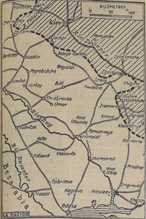
Mientras los ejércitos rusos han recobrado la iniciativa en la saliente de Kiev, donde permanecían desde largo tiempo a la defensiva, han continuado reduciendo el "bolsillo" formado en el sector de Smela, marchando sobre Cherkassy, rebasando Chigirin y completando el cerco de Kirovo o Kirovograd.