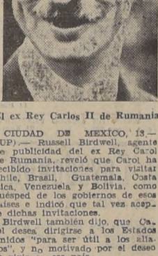
El ex Rey Carlos II de Rumania

AVIACION DE EE. UU. ATACO N. E. DEL REICH VISITARIA CHILE Centros militares e industriales destruidos Bombardeado el aeropuerto de Schipol, Holanda