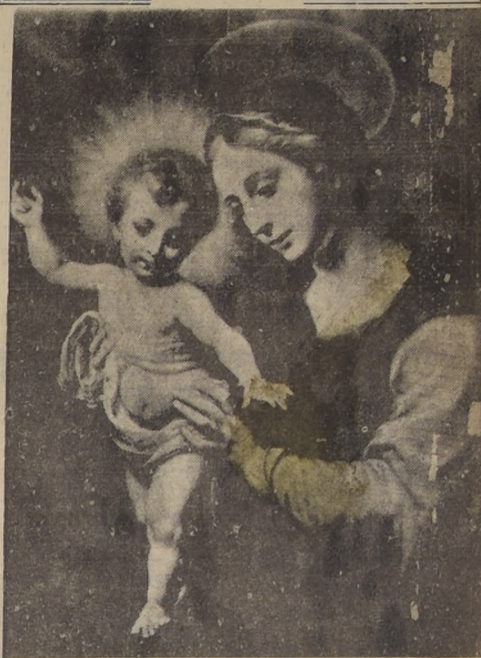
La Virgen y el Niño, por C. Dolci, (Galería Borghese, Roma)