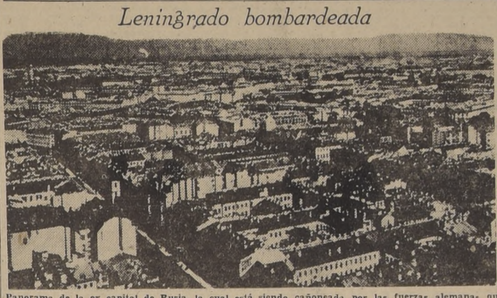
Panorama de la ex capital de Rusia, la cual está siendo cañoneada por las fuerzas alemanas, que operan en el frente del Báltico

Este simpático grupo de enfermeras de la Cruz Roja americana se da un corto respiro, después de cumplir la pesada y peligrosa tarea de trasladar a los heridos a un puesto de cirugía de urgencia, y se prepara una rápida colación al abrigo de las tiendas de campaña.