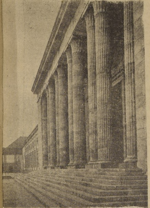
El nuevo edificio de la Cancillería del Reich, destruido durante la incursión aérea de ayer. En este lugar tenían sus oficinas Hitler y von Ribbentrop.