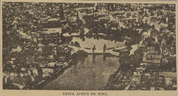
VISTA AEREA DE KIEL