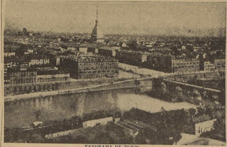
PANORAMA DE TURIN

ARGEL, 4 (U. P.).—Mientras el 8.º ejército continuó su difícil avance por la costa del Adriático, y las tropas de general Mark reanudaron sus operaciones en el frente de tres días de tregua impuesta por una de las más grandes tormentas que azotó a Italia en muchos días, las tropas norteamericanas llegaron ayer a una importante planta de rodamientos de Turin, que virtualmente arrasaron con sus poderosas bombas.