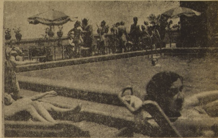
Muy concurrida ha estado durante los últimos días de calor la hermosa Piscina situada en el 17.º piso del Hotel donde el público tiene oportunidad de refrescarse, tomar el sol y admirar el panorama de nuestra ciudad.