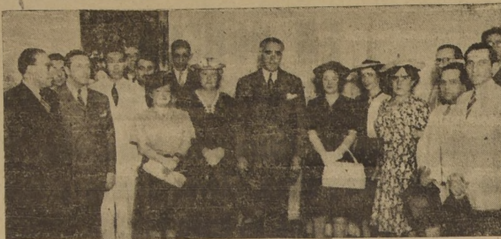
S. E. acompañado de los Ministros de Educación y de Justicia y de algunos delegados al Congreso Panamericano de Maestros.

Los delegados americanos sus excusas por haberle sido imposible concurrir al acto inaugural del IV Congreso, pero manifestó que había seguido con gran interés su desarrollo imponente. La entrevista fue extraordinariamente cordial. S. E. expresó