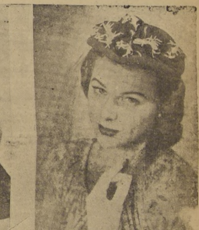
Sombrero de fieltro. Detalles característicos son las preciosas flores con fondo de contrastes y un copioso velo que puede prenderse bajo la barba o en la nuca del cuello.