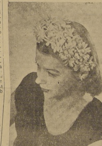
Sombrero feligranado con margaritas de terciopelo montadas en corona de terciopelo para ajustarse mejor. En delicados matices de acuarela.