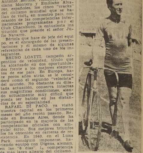
Los cinco ciclistas extranjeros que visitaron ayer 'La Nación'.