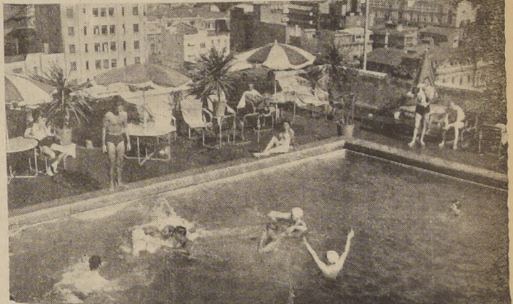
Cada día es mayor el número de personas que asisten a la hermosa piscina situada en el 17.º piso del Hotel, donde pueden practicar el deporte de la natación y aprovechar el sol de los días de verano en un ambiente cómodo, distinguido y agradable.