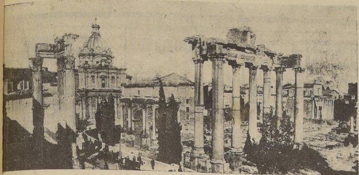
Las ruinas del Foro y el Panteón de Agripa, en Roma