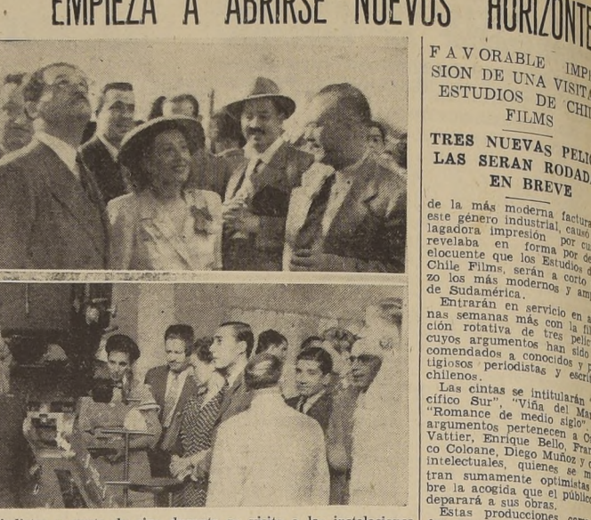
Periodistas y gente de cine durante su visita a las instalaciones de Chile Films en la Avenida Colón.

La más moderna industria en este género industrial, causó la lagadota impresión por su claridad en forma por donde elocuentemente que los Estudios de Chile Films, serán a corto plazo los más modernos y amplios de Sudamérica. En estas semanas se han iniciado las sesiones de estudio de las películas, con una rotativa de tres películas, con argumentos bien elaborados, conmovedores a conocer y prestigiosos por periodistas y estudiantes. Estas producciones comprenden una parte del plan de películas que en este año de películas se han producido en Chile. El destino de la Chile Films está entregado a hombres responsables con enorme experiencia en el cine mundial. Cada uno de ellos tendrá una delicada misión que cumplir en la organización del plan que se proponen desarrollar. No será el que sucederá, menos no tiene por qué suceder, sino que se han circunscrito su labor al bluf de la propaganda interesada. Los Estudios de la Chile Films, que entregará al mercado películas que confirmen las aspiraciones del público y de los entendidos en la materia.