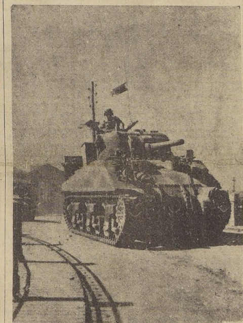
Un tanque "General Grant", avanza hacia el interior en los primeros momentos del desembarco

MOSCU, 28. — (U. P.). — (Por Henry T. Shapiro). — Las fuerzas del general Meretzkov se anexionaron hoy un resonante triunfo al cortar, avanzando por el frente en forma de herradura, el principal ferrocarril de Moscú, a casi 60 kilómetros al oeste de Novorod y a 100 kilómetros al sur de Leningrado, con la ocupación de Peredolskaya, a casi 60 kilómetros al oeste de Novorod, y a 100 kilómetros al sur de Leningrado con Pakov.