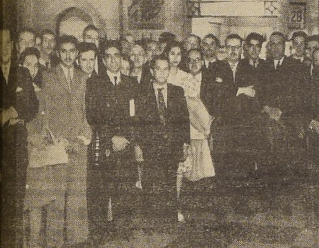
Una parte de la delegación que nos visitó ayer

TEXTO DE UNA SOLICITUD ENTREGADA AYER AL M. DEL TRABAJO, POR LOS EMPLEADOS DE LOS BANCOS ALEMAN TRANSATLANTICO Y GERMANICO PARA LA AMERICA DEL SUR.—VISITA A "LA NACION"