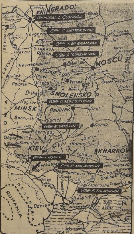
En el presente mapa puede apreciarse, en forma aproximada, la posición de los beligerantes en el frente de Rusia y los nombres de los generales que mandan las operaciones en los diversos sectores