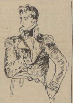
Lord Tomás Alejandro Cochrane, primer Almirante de la Armada Nacional