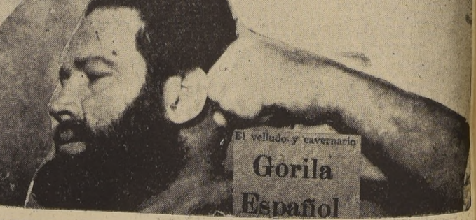
El velludo y cavernario Gorila Español

El Club Unión Chile es el nombre de una institución del barrio Sur Poniente formada en su mayoría por complexos obreros y estudiantes de ese sector.