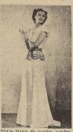
Traje largo de noche, confeccionado de crepé d'eseda blanca, sobre refajo de crepé blanco...