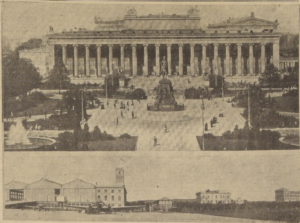
La fotografía de arriba muestra el Museo Reat de Berlín y el monumento a Federico Guillermo III, situados en el Lustgarten. — La de abajo corresponde al aeropuerto de Littorio, bombardeado ayer por las fuerzas aéreas aliadas

MOSCÚ, 3. (U. P.) — (Por Harrison Salisbury). — Las fuerzas soviéticas continuaron avanzando hoy en los extremos de su frente de 225 kilómetros, llegando en el punto meridional a 12 kilómetros al este de Pskov mientras que ampliaron sus líneas al suroeste del rodeado bastión estoniano de Narva en el norte.