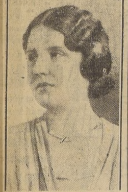
S. A. R. la princesa Juliana de Holanda

CARACAS, 3. (U. P.) — La Princesa Juliana de Holanda, acompañada de su séquito, llegó al aeródromo de Maquieita a las 9.30 A.M. hora de Venezuela, en un avión especial que fue escoltado por bombarderos norteamericanos y un avión de las fuerzas holandesas.