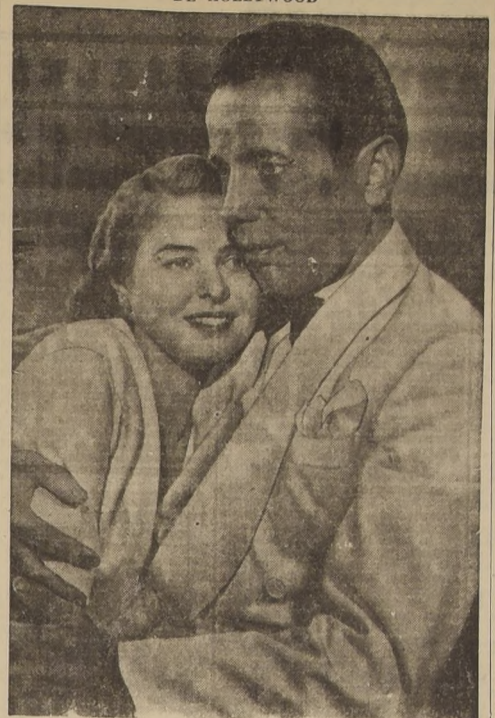
Ingrid Bergman and Humphrey Bogart, protagonistas de "Casablanca"

JENNIFER JONES FUE CALIFICADA COMO LA MEJOR ACTRIZ DEL AÑO. — PREMIOS OTORGADOS POR LA ACADEMIA DE CIENCIAS Y ARTES CINEMATOGRAFICAS DE HOLLYWOOD