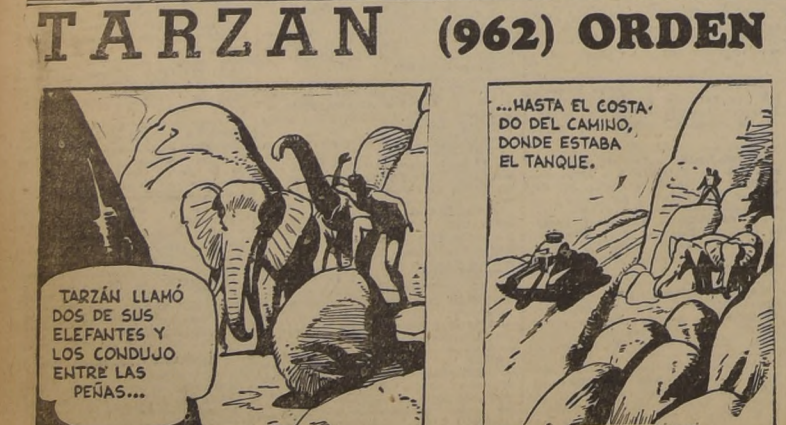
TARZAN LLAMÓ DOS DE SUS ELEFANTES Y LOS CONDUJO ENTRE LAS PEÑAS...