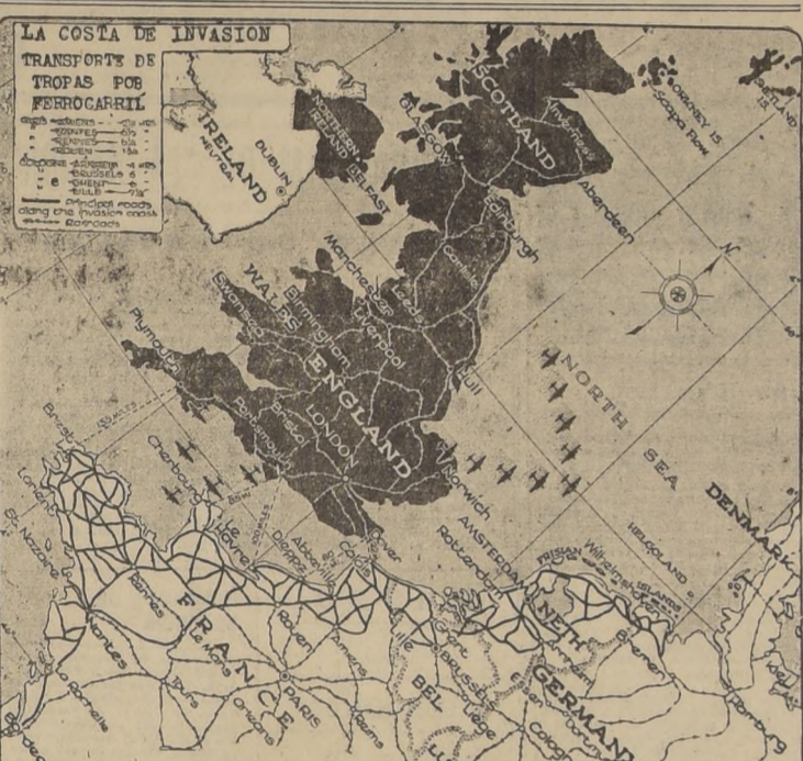
Este mapa de la costa de invasión señala el buen sistema de comunicaciones que servirán a los alemanes cuando los ejércitos aliados, han con su tan esperado asalto contra la fortaleza nazi. Debido a lo complejo del detalle, las líneas ferroviarias en la costa propiamente tal, no han sido señaladas.