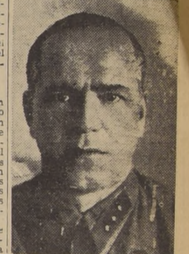
General Gregory Zhukov

Prisioneros alemanes informan que el alto comando nazi había esperado que el tiempo les daría un respiro que les permitiera retirar sus divisiones agotadas y reemplazarlas por refuerzos de la reserva y equipo nuevo, pero la cortadura del ferrocarril de Tarnopol a Proskurov,