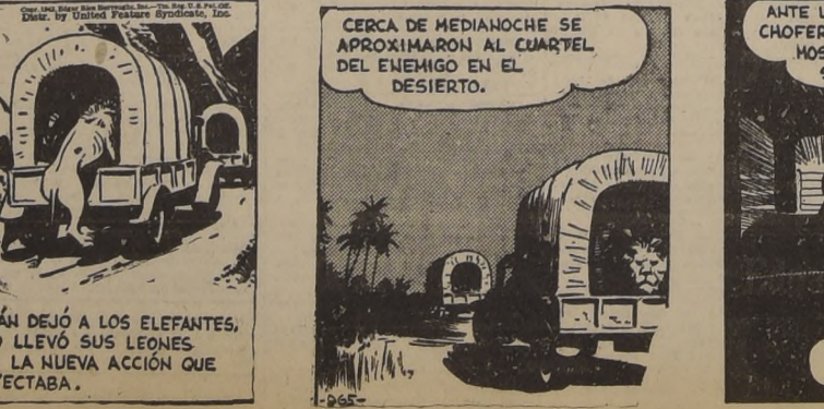
CERCA DE MEDIANOCHE SE APROXIMARON AL CUARTEL DEL ENEMIGO EN EL DESIERTO.

ENTRADA POR E. MAC-IVER 242 Hoy Viernes 10 de Marzo de 10 a 12.30 y 14.30 horas adelante