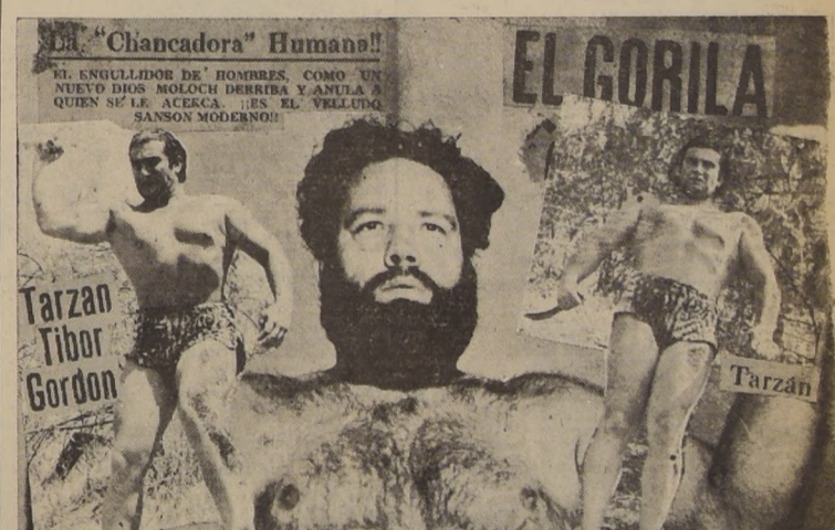
El escudador de hombres, como un nuevo héroe, se enfrenta a Olagubel, quien se le aceca, en el combate. Sanson Moderno.