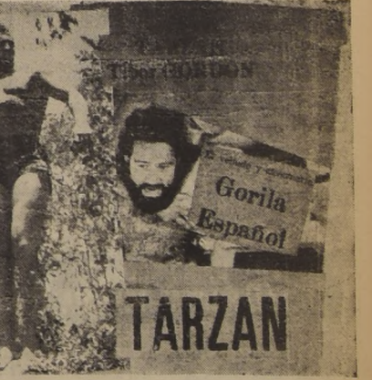
Tarzan derrotó a sus pies, cual un nuevo dios Moloch, a los dos gigantes...