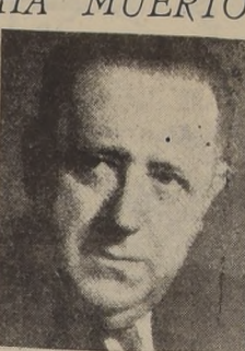
Hendrik Willem Van Loon