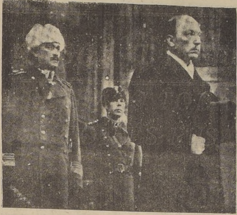
Presidente Ryti, de Finlandia, acompañado del Mariscal Mannerheim

LONDRES 15. — (U. P.) — La British Broadcasting Corporation Finlandia, dando la siguiente importante declaración que define la actitud británica ante la crisis finlandesa: "La Nación finlandesa encara la más trascendente decisión de su historia. Dentro de pocas horas y aún puede ser en pocas horas más el pueblo finlandés debe decidir si acepta las condi-