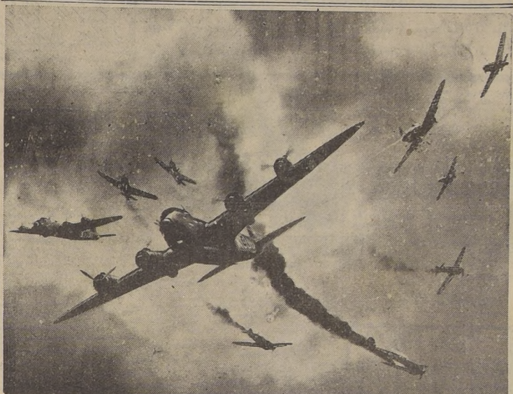
Durante las incursiones contra Berlín y Brunswick, los cazas aliados derribaron 36 máquinas alemanas de las escasas formaciones que intentaron interceptar a los atacantes. Aquí representamos una visión de la lucha en el aire

También fueron tomados en el (PASA A LA PAGINA 6)