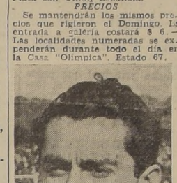
Campaña, insider de los rojos