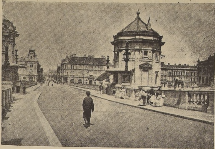
Un aspecto de la ciudad de Szegedin visto desde el puente grande, sobre el Thenev