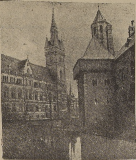
La casa consistorial de Brunswick y el palacio de Dankwarderode, construido por Enrique el León en 1175.

americanos efectuaron el centésimo ataque contra las bases japonesas de las islas Mar-