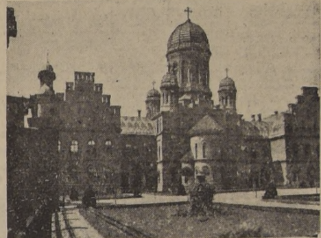
La basilica y la residencia del Metropolitano de Bukovina en Cernauti o Czerhovitz.

LA CAPITALIZADORA NACIONAL SUS POLIZAS SIGNIFICAN Ahorro, tranquilidad o inmediato capital