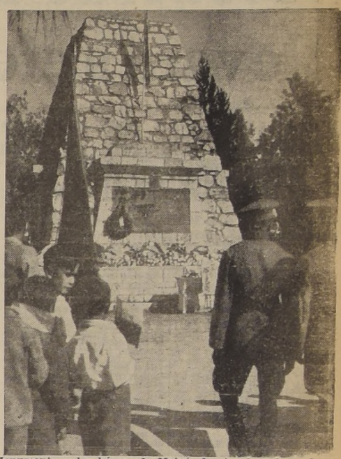
Monumento a los héroes de Maipú, frente al cual se efectuarán los actos de hoy

La República celebra hoy uno de los hechos, guerreros más importantes de nuestra historia militar, la batalla de Maipú, librada hace 126 años en el vecino y histórico pueblo de ese nombre, hecho de armas que consolidó definitivamente la independencia de Chile. Actualmente las autoridades eclesásticas y militares están patrióticamente interesadas en dar cumplimiento al voto de O'Higgins, formulado en aquella ocasión, a los pies de la Virgen del Carmen, Patrona del Ejército Chileno, de levantar un Templo Votivo Nacional en el mismo lugar de la batalla, como reconocimiento a la protección que ella concediera a las huestes patriotas.