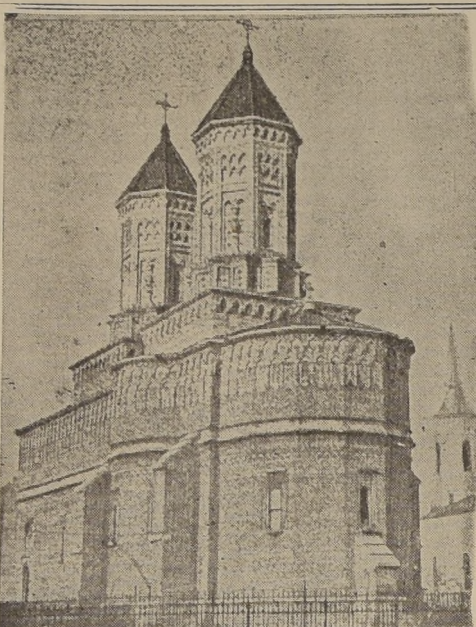
La iglesia de los Tres Jerarcas, en Jassy