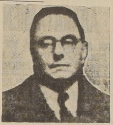
El mayor Enrique Veliz, fallecido ayer.

En el Hospital Militar falleció ayer a mediodía el mayor de Ejército don Enrique Veliz Lencoeck, que prestaba sus servicios en el Regimiento de Infantería No 1 "Buin".