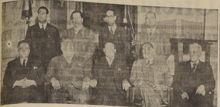
El Ministro del Trabajo acompañado de miembros del Consejo y altos jefes del Crédito Popular

ESTUVIERON PRESENTES ALTOS JEFES DE LOS SERVICIOS POPULARES