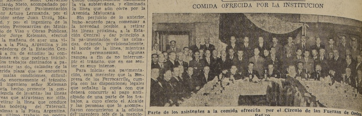
Parte de los asistentes a la comida ofrecida por el Circulo de las Fuerzas de Retiro