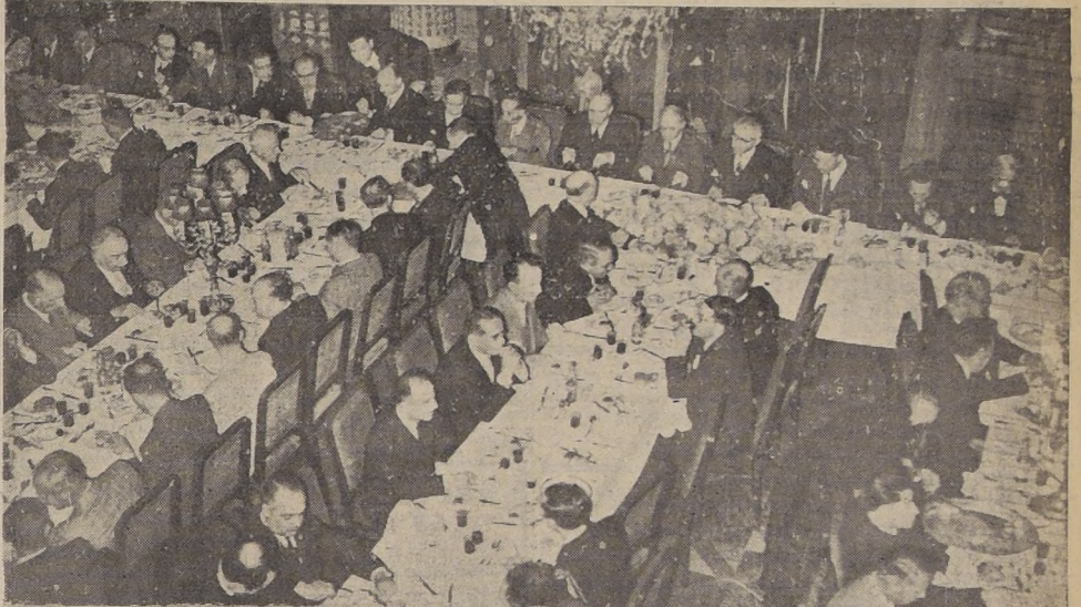
Un aspecto del banquete de ayer.

"LA LIBRA ESTERLINA ES Y SE MANTENDRA COMO UN CIRCULANTE ESTABLE EN EL MUNDO COMERCIAL"