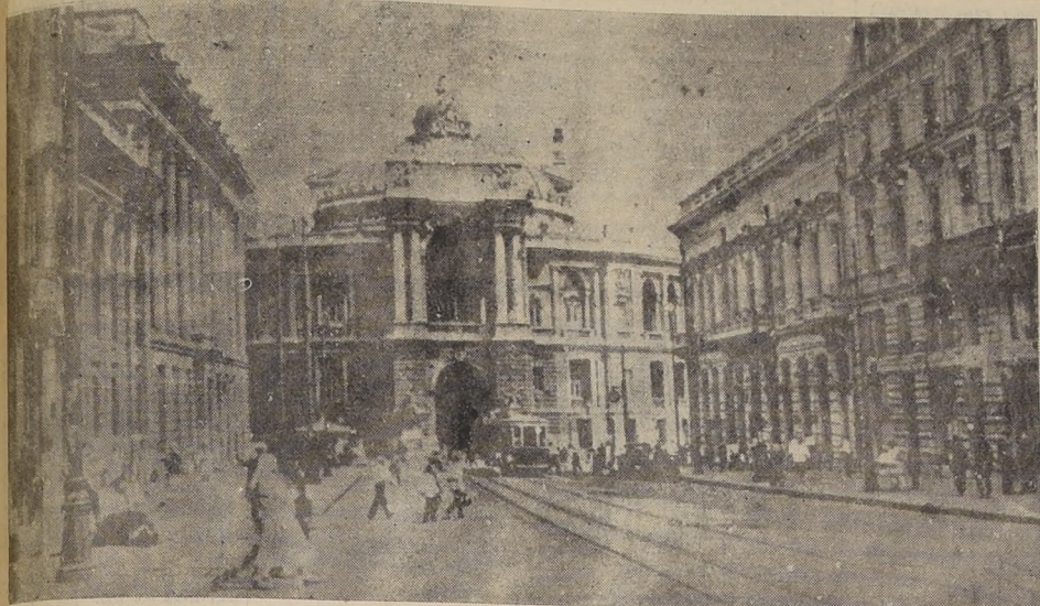
Una Avenida en Odesa; al fondo el Teatro de la Opera