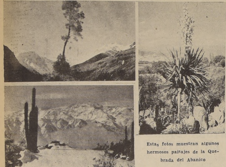
Estas fotos muestran algunos hermosos paisajes de la Quebrada del Abanico

A cuarenta minutos de viaje en automóvil desde la Plaza de Armas de Santiago, se encuentran enclavados en los primeros cerros cordilleros de Peñalolen, en la Quebrada del Abanico, a mil quinientos metros de altura sobre el nivel del mar, una de las instituciones educacionales más avanzadas de nuestro país, el Colegio "Nido de Aguilas".