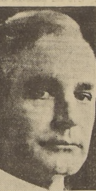
Mr. Cordell Hull

WASHINGTON, 8. — (U. P.). — El Secretario de Estado Mr. Cordell Hull pronunciará el domingo en la noche su discurso, esperado desde hace tiempo, sobre la política exterior de los Estados Unidos, lo que tendrá lugar unos cuantos días antes de que el Congreso vuelva a sesionar para escuchar su plan de organización internacional y de mantenimiento de la paz.