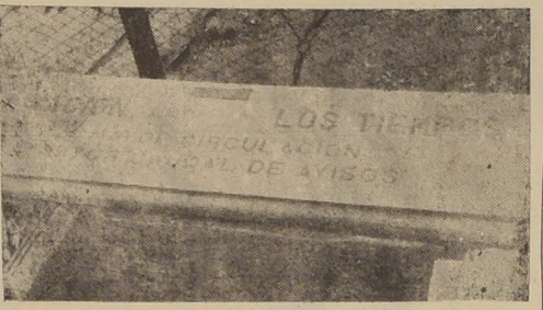
Banco donado por LA NACION, al Jardín Zoológico

El Director General de Informaciones y Cultura debe arbitrar los medios necesarios para subsanar la deficiencia de personal, el público no tiene otra base que el de molestar a un hombre que ha entregado los mejores años de su vida a este servicio.