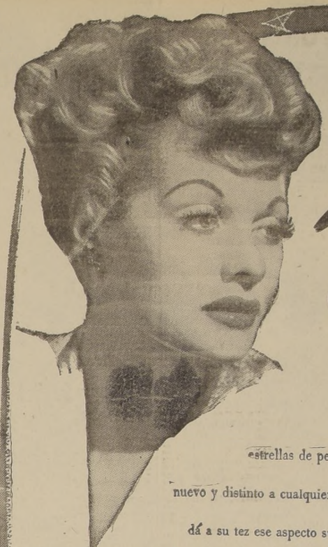
LUCILLE BALL Estrella de MGM

En el panorama armónico de la plástica italiana del Renacimiento es Miguel Ángel un alma solitaria, potente y sombría. Un alma dolorosa y, al mismo tiempo, estremecida en la pasión y en la fiebre del trabajo. Una especie de monstruo del laberinto de su existencia, un incomparable genio, violento y pesimista, que levantaba la vida en la palpitation majestuosa de sus mármolos. Una figura tan plenamente heroica debía de seducir a la pluma acuciosa de Hermann Grimm, catedrático de Historia del Arte en Berlín, dado a la interpretación del mundo artístico italiano a través de sus hombres más representativos. Grimm escribió a finales del siglo pasado esta vida de Miguel Ángel que ahora aparece por vez primera en su versión castellana. Y trazó en ella la imagen del pintor de la Sixtina muy de acuerdo con la índole pétrea y mecánica del modelo florentino. Pero no es esta una silueta exclusiva del artista, sino un vasto fresco —de proporciones casi miguelangelescas en sus 600 páginas— del que surge con potencia descolante el genio y la aventura de Miguel Ángel. El panorama y el ambiente que envuelven al escultor es la vida