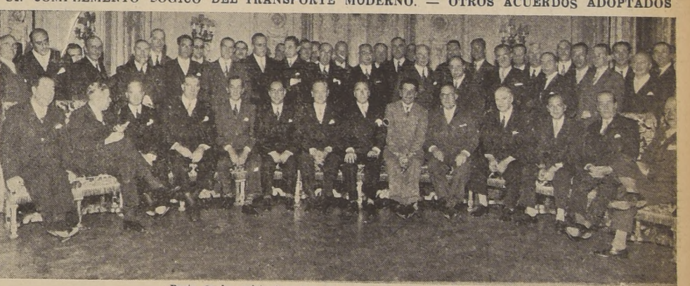
Parte de los asistentes al banquete de anoche en el Club de la Unión.

SE BUSCARA LA POSIBILIDAD DE VINCULAR EL TRANSITO TERRESTRE CON EL AEREO COMO UN COMPLEMENTO LOGICO DEL TRANSPORTE MODERNO. — OTROS ACUERDOS ADOPTADOS