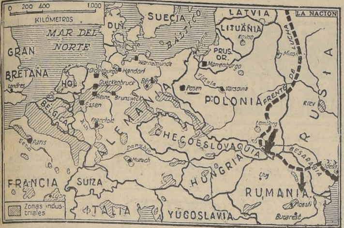
La aviación aliada ha realizado en los últimos días extensas operaciones contra objetivos del Reich desde el centro de Francia (Bourges) hasta Polonia (Posen) y Prusia Oriental (Marienburg). Los cuadros negros señalan los aeródromos y centros industriales atacados en Alemania y Polonia.

Aeropuertos de Francia y Bélgica bombardeados por la U.S.A.A.F,