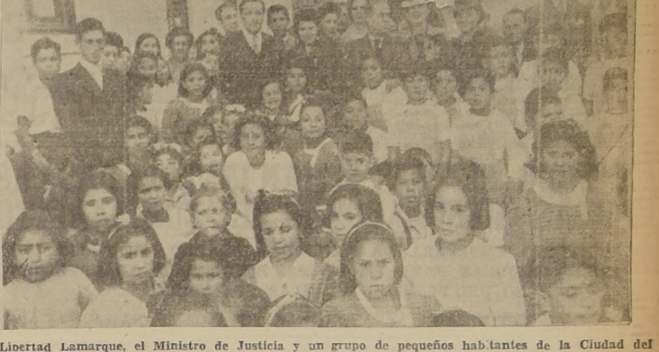
Libertad Lamarque, el Ministro de Justicia y un grupo de pequeños habitantes de la Ciudad del Niño, durante la visita que a esta institución

La artista argentina Libertad Lamarque dejará vinculada su nombre a una de las obras nacionales de más trascendencia como es la "Ciudad del Niño Presidente Ríos". Como una demostración de agradecimiento hacia Chile, Libertad Lamarque ofreció a S. E. el Presidente de la República, y al Ministro de Justicia y al Presidente del Consejo de Defensa del Niño, un festival completo a favor de esta obra.