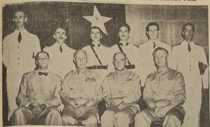
CON ESTE MOTIVO SE RINDIO HOMENAJE A NUESTRO PAIS