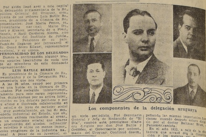
Los componentes de la delegación uruguaya

ESTA PRESIDIDA POR EL SR. LUIS BATLLE BERRES, PRESIDENTE DE LA CAMARA DE REPRESENTANTES, E INTEGRADA POR OTRAS DESTACADAS PERSONALIDADES