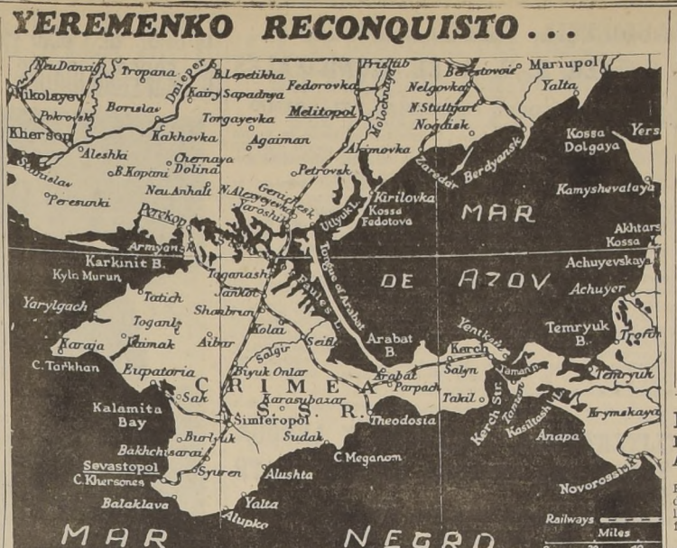
(DE LA PRIMERA PAGINA)