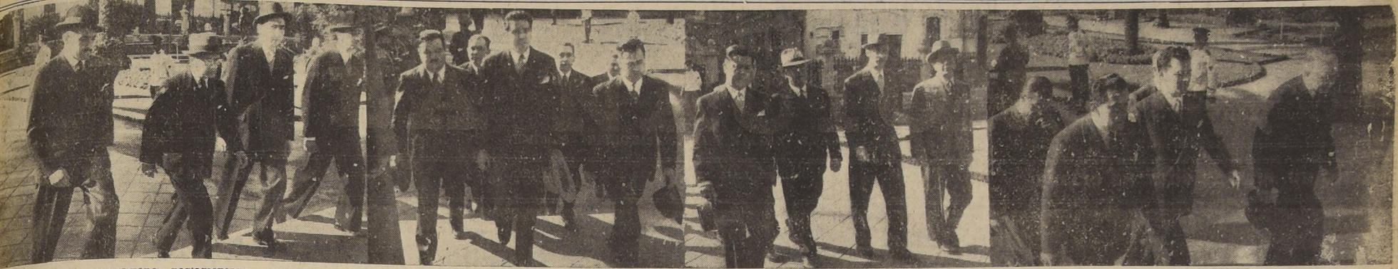
Integrantes de las delegaciones parlamentarias americanas en los momentos de su llegada al Salón de Honor del Congreso Nacional, para asistir a la sesión solemne celebrada ayer por la Cámara de Diputados, con motivo del "Día de las Américas"