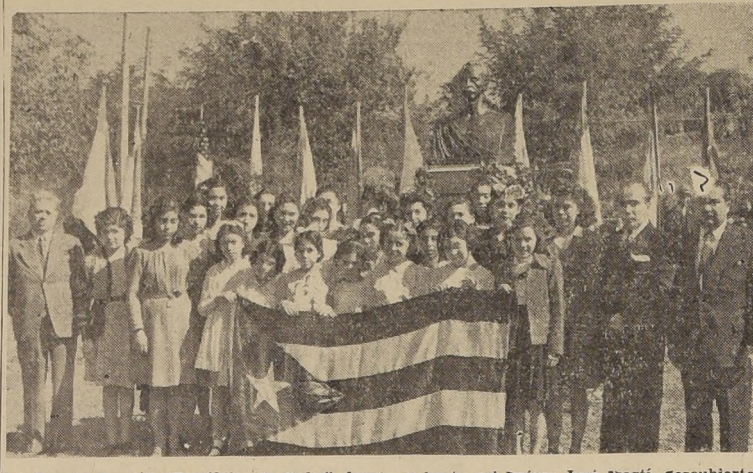
La Escuela N.º 106, "República de Cuba", frente al busto del Prócer José Martí, descubierta ayer.

CON TAL MOTIVO SE DESARROLLO UNA PATRIOTICA CEREMONIA EN PRESENCIA DE LAS DELEGACIONES PARLAMENTARIAS AMERICANAS — BRILLANTES DISCURSOS DEL ALCALDE SAN MIGUEL Y EMB. DE CUBA