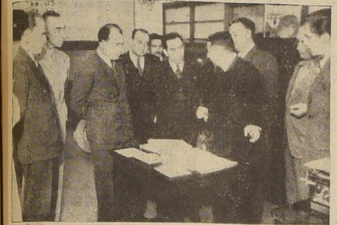
Durante la visita de los parlamentarios mexicanos al Consultorio Maruri

GRATA IMPRESION RECOGIERON DE LA ORGANIZACION DE LOS SERVICIOS DE LA CAJA DE SEGURO OBRERO