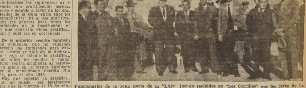
Funcionarios de la zona norte de la "LAN" fueron recibidos en "Los Cerrillos" por los jefes de la Empresa en Santiago

EN UNA CONCENTRACION QUE SE INAUGURA HOY, Y A LA CUAL CONCURRIRAN LOS JEFES DE ESTA EMPRESA AEREA Y LOS JEFES DE PUERTO