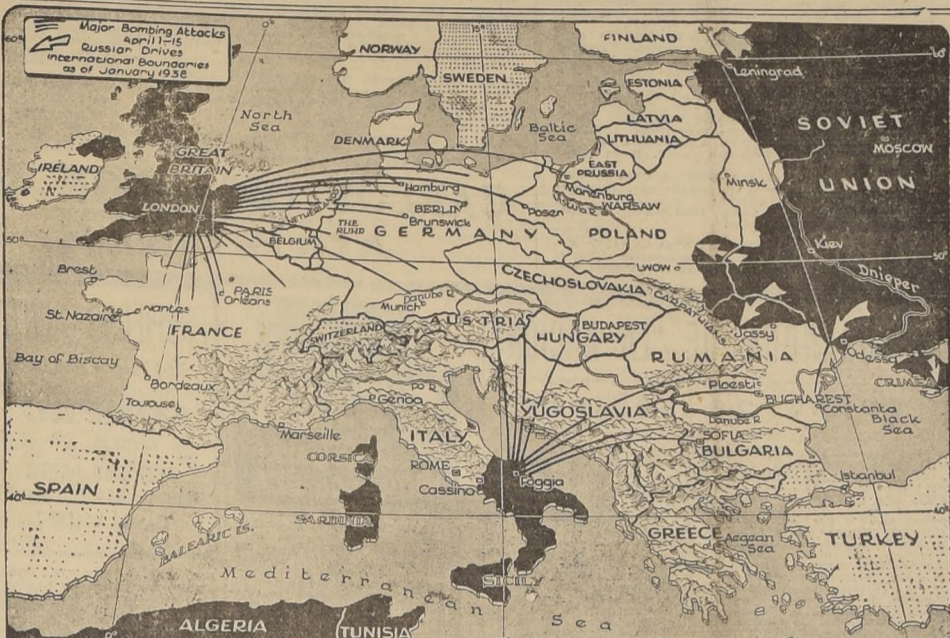
La "Fortaleza Europa", atacada por el Este, Oeste y Sur. Las líneas negras señalan las principales incursiones aéreas emprendidas por los aliados desde Italia e Inglaterra, en la primera quincena de abril. Las flechas blancas indican la dirección de las ofensivas rusas. Los límites internacionales son los que rigieron hasta enero de 1938.

MOSCU, 25 (U. P.).—(Por Harrison Salisbury).—En el curso de un día de combates en el extremo sur de la gran ofensiva rusa, mientras ambas partes se preparaban para una batalla decisiva que ha de decidir la suerte de los millones de soldados que se encuentran en este tratando de avanzar hacia el este de la gran ofensiva rusa, se aprecia el valor de Sebastopol, que no sólo es un punto vital, sino que también es un punto vital de la gran ofensiva rusa.