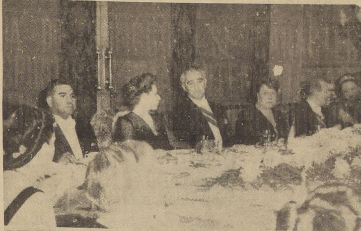
La mesa de honor en el banquete de anoche