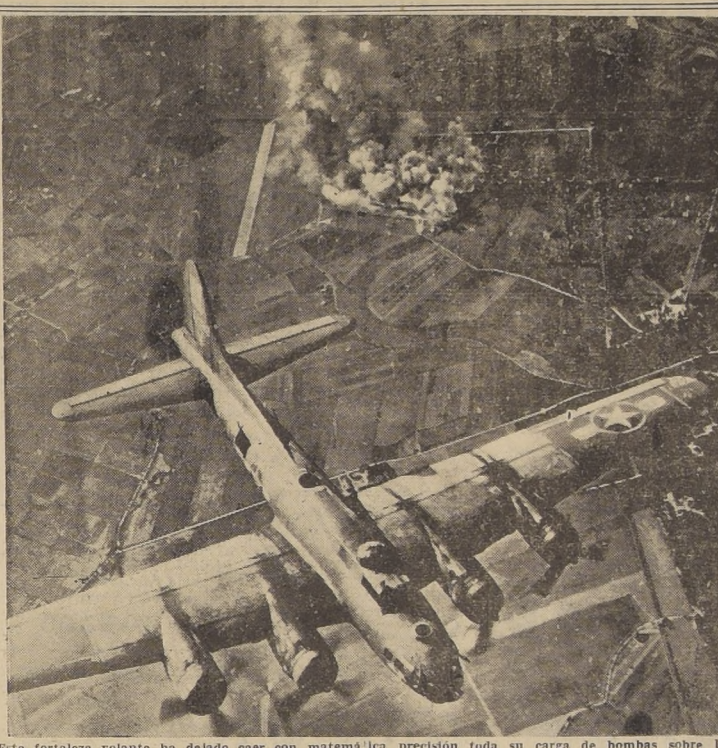
Esta fortaleza volante ha dejado caer con matemática precisión toda su carga de bombas sobre la fábrica de aviones Focke-Wulf que se ve ardiendo en la lejanía.

Las grandes batidas diurnas sobre la primera línea de las defensas alemanas contra la invasión, fueron precedidas por un ataque nocturno de la R.F.A. en el cual los misiles objetivos de Friedrichshaven recibieron una lluvia de bombas a razón de 100 toneladas por minuto, en tanto que cerca de 1.000 bombarderos británicos lanzaban poderosas bombas sobre los centros ferroviarios de Montzen, en Bélgica, a 15 kilómetros de Aquigrán y sobre el ramal ferroviario que lleva a Lilla, y Aulnoye, en el norte de Francia. Los Mosquitos de la R.F.A. completaron la ofensiva nocturna con un asalto con bombas demolidoras en Langerwehe, cerca de Stuttgart, uno de los principales centros de producción bélica del sur de Alemania.