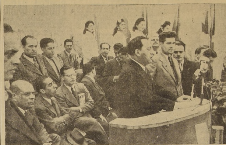
La directiva que presidió la concentración de ayer.