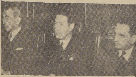
Durante la velada en la Escuela "República Argentina" — La Mesa de Honor, del acto realizado en la Universidad de Chile