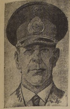
Excmo. señor General Edelmiro J. Farrell, Presidente de la República Argentina, que celebra hoy el 124.º aniversario de su Independencia