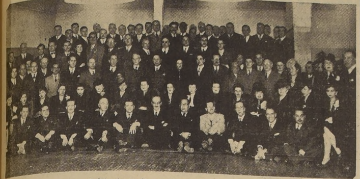
Asistentes a la manifestación de ayer